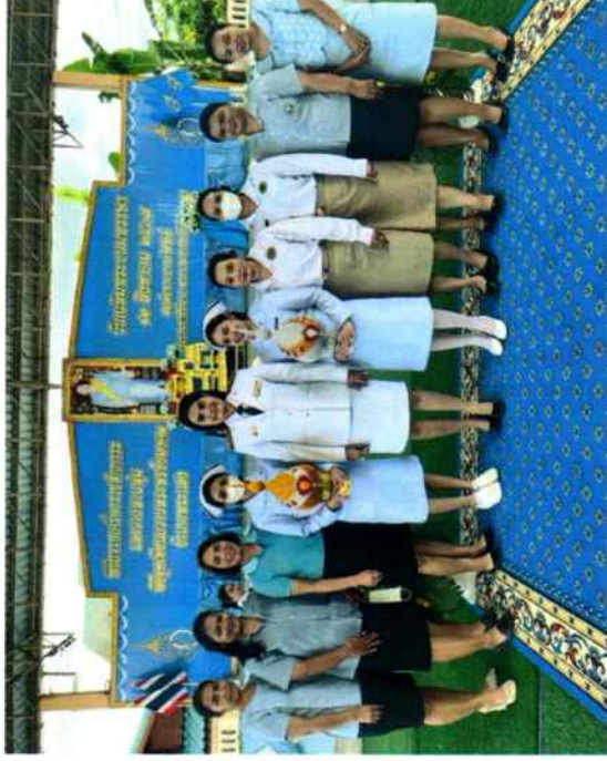
กิจกรรมพืธางพวงมาลาเนื่องในโอกาสวันเฉลิมพระชนมพรรษา สมเด็จพระนางเจ้าสุทิดา พัชรสุธาพิมลลักษณ พระบรมราชินี